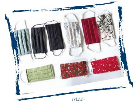
Idee: Masken aus alten Kleiderstücken