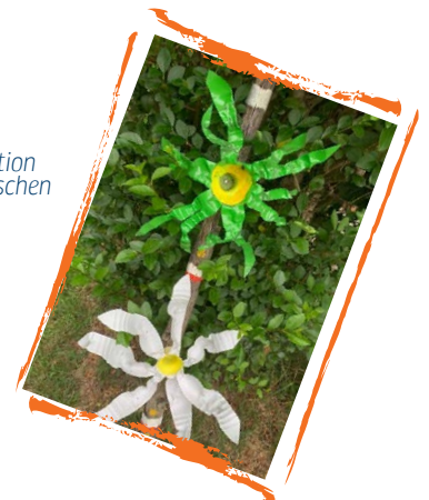
Idee: Gartendekoration aus Plastikflaschen